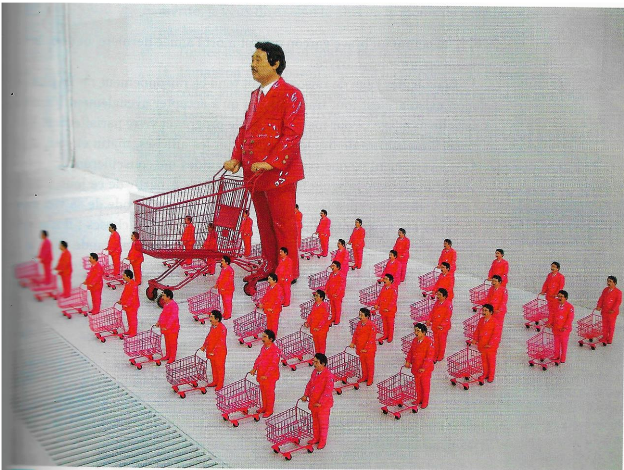
Wanit Sriwanichpoom, L'icône du consumérisme (2008), résine et métal (40 x 30 x 14,5 cm), Bangkok (Thaïlande).