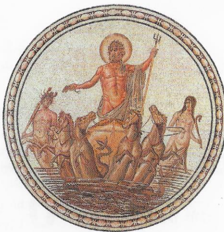
Neptune (Poséidon) sur son char, détail de la mosaïque Neptune et les Saisons (1 re moitié du II e siècle) provenant d'une villa près de La Chebba (Tunisie).